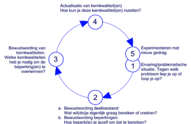
Figuur 2 Het model voor kernreflectie (Korthagen & Lagerwerf, 2011).

Na deze bewustwording worden in fase vier meerdere alternatieven geformuleerd en wordt gekeken wat er meegenomen wordt naar de toekomst.