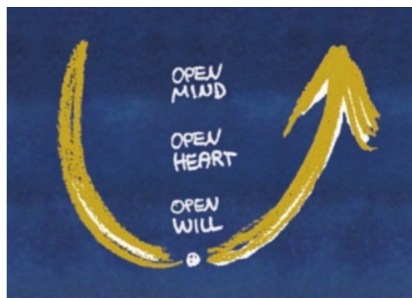
Figuur 2. U-theorie van Scharmer (2007, p. 57)