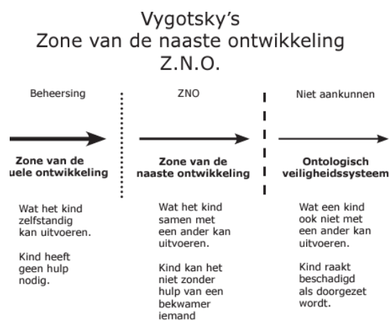
Figuur 1 Zone van de naaste ontwikkeling.

"Ondanks de bewezen effectieve methode Scaffolding wordt het te weinig in de klas gebruikt."